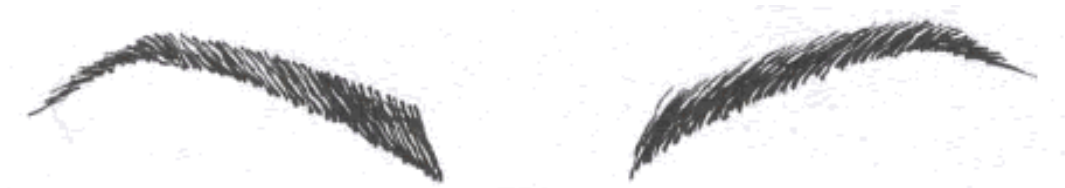
Gb.163 Ujung alis sedikit tajam

wajah bentuk pear tidak cocok menggunakan alis berbentuk melengkung tetapi dibuat agak mendatar.