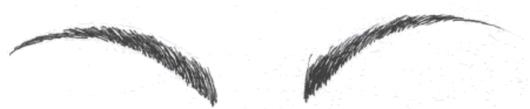
Gb.160 Alis melengkung lembut

wajah bentuk persegi alis dibentuk melengkung, puncak alis dibentuk melengkung dan harus tebal sampai puncak alis serta pada ekornya tipis.