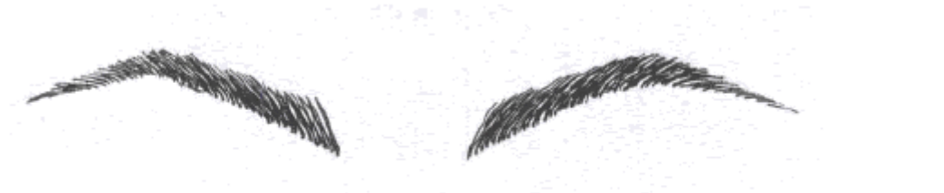
Gb.159 Alis tajam

wajah bentuk bundar, alis jangan terlalu besar, puncak lengkungan alis tidak berbentuk bundar tetapi sedikit bersiku.