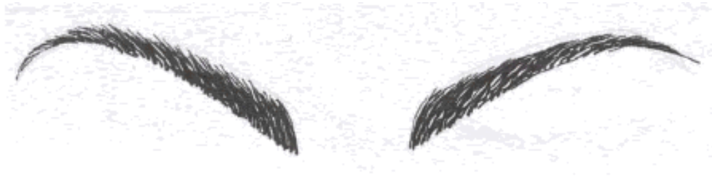
Gb.162 Ujung luar alis melengkung

wajah bentuk belah ketupat, bentuk alis hampir sama dengan alis untuk muka bentuk persegi tetapi ekor alis mengarah ke bawah.