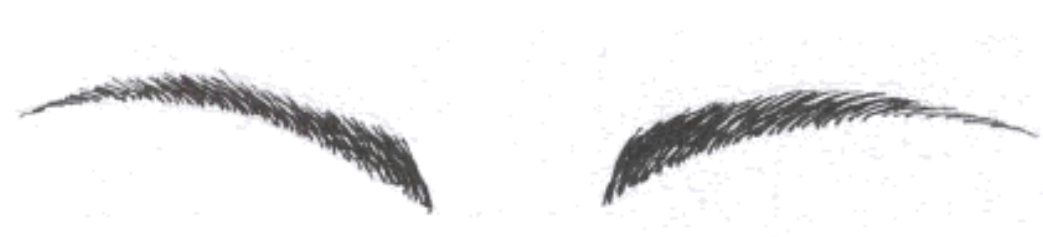
Gb.161 Alis mendatar

wajah panjang, bentuk alis jangan terlalu melengkung, karena muka akan tampak bertambah panjang. Lengkung alis dibentuk agak rendah. Lebar atau besar alis pada bagian pangkal dan ujung alis jangan terlalu jauh berbeda.